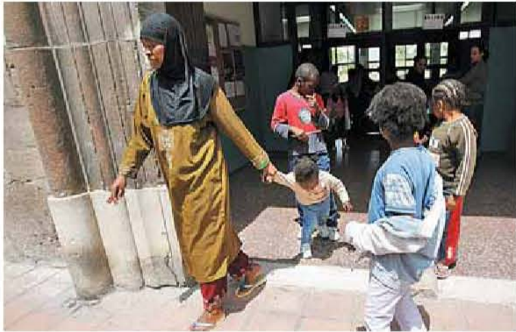
Alumnado inmigrante a la salida del colegio público Santo Domingo de Zaragoza.

nes no quieren cursar esta asignatura". Además, solicitaron que se retire la financiación pública a aquellos colegios que no respeten la "libertad de pensamiento". A esta propuesta se sumaron otras reivindicaciones como la distribución igualitaria del alumnado inmigrante en los centros escolares para evitar la formación de guetos.